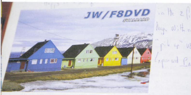
QSL-KORT: Svalbard har bokstavene JW i sitt kallesignal. Dette QSL-kortet er limt inn i gjesteboka til Svalbardgruppen.

– Jeg har satt opp deltakerne i forhold til de ulike tidssonene, så alle har mulighet til å få kontakt med sitt eget hjemland, forklarer